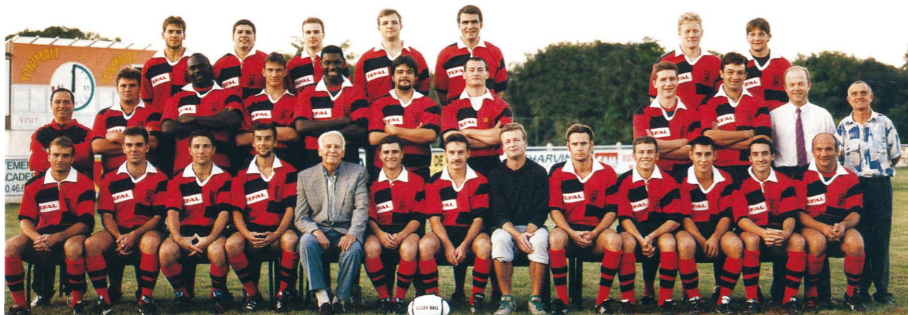
L'équipe du Top 16 saison 1994-1995 (de gauche à droite)

Date de fondation : 1987 Division : Série régionale