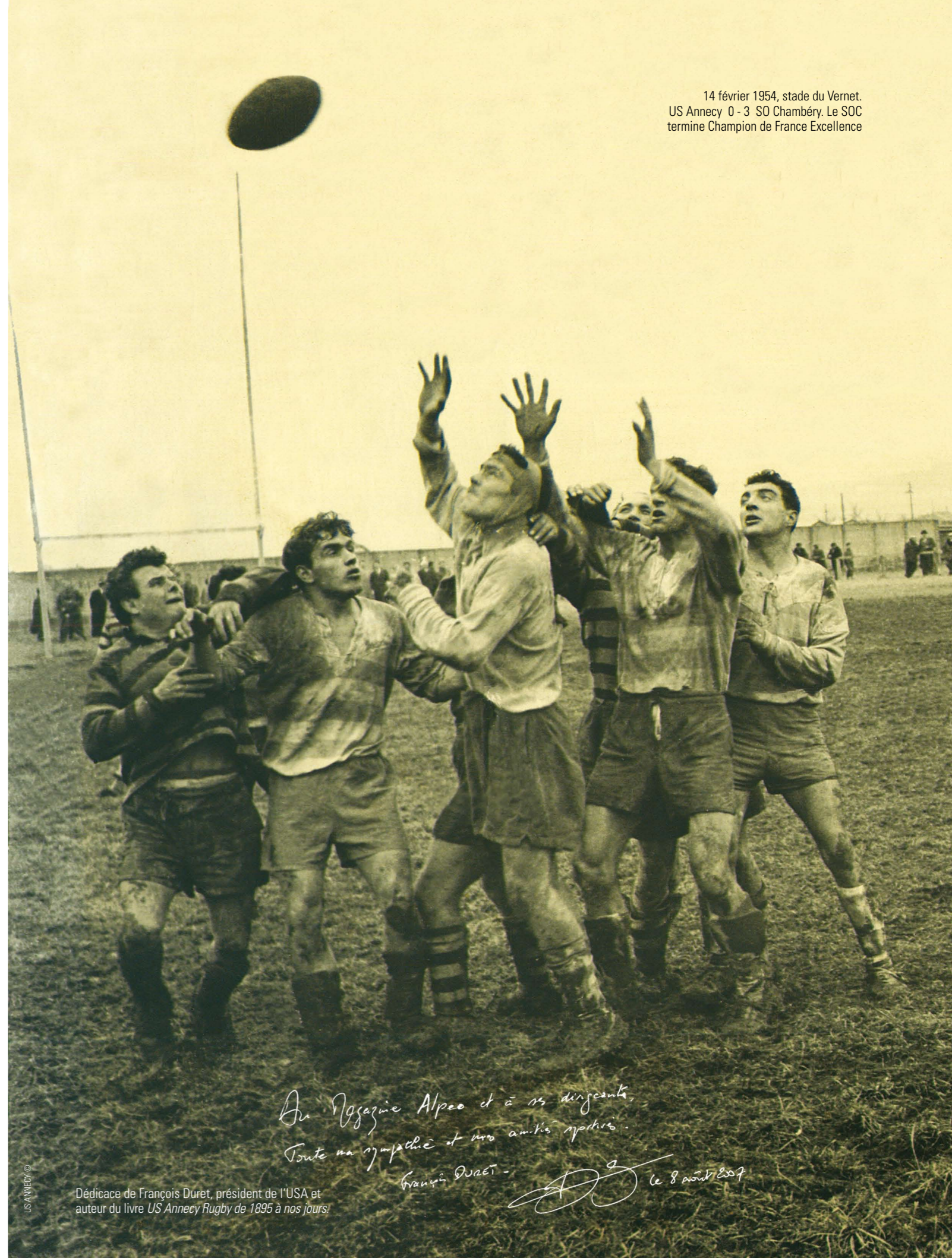
14 février 1954, stade du Vernet. US Anancy 0 - 3 SO Chambéry. Le SOC termine Champion de France Excellence